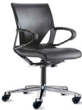
283 / 81

Elegant geschwungene Armlehnen, die man gerne sieht – und gerne anfasst: Die Außenfläche ist komplett mit einer fein gearbeiteten Lederauflage gepolstert. Die prägnanten Ausschnitte der Rückenlehne werden im Sitzträger harmonisch aufgenommen und gebündelt.