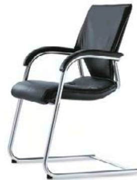
287 / 81