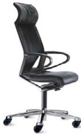
284 / 81